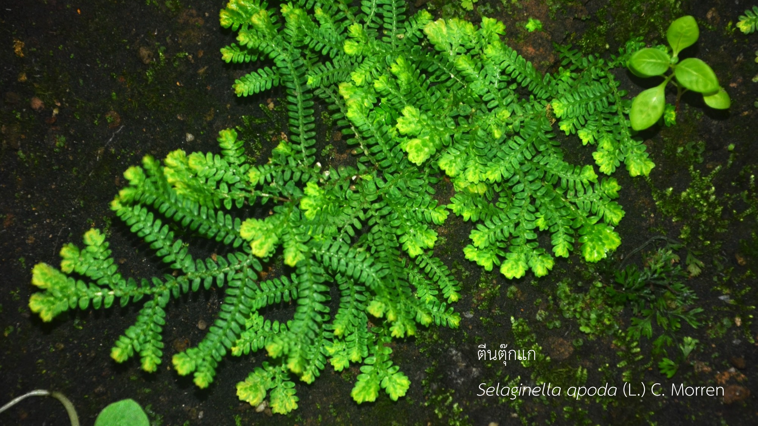
ตีนตุ๊กแก