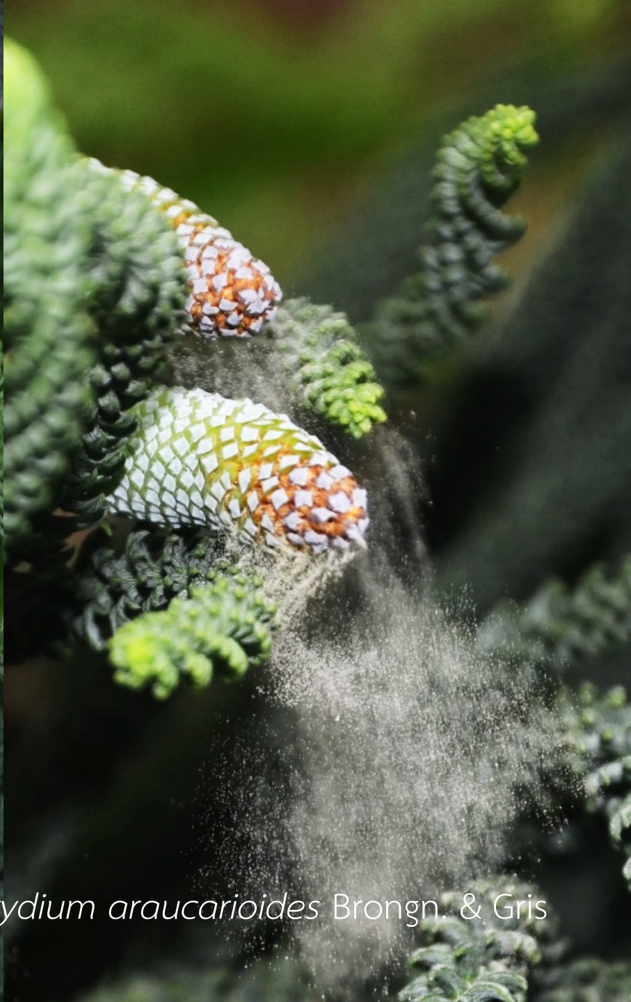
Dacrydium araucarioides Brongn. & Gris