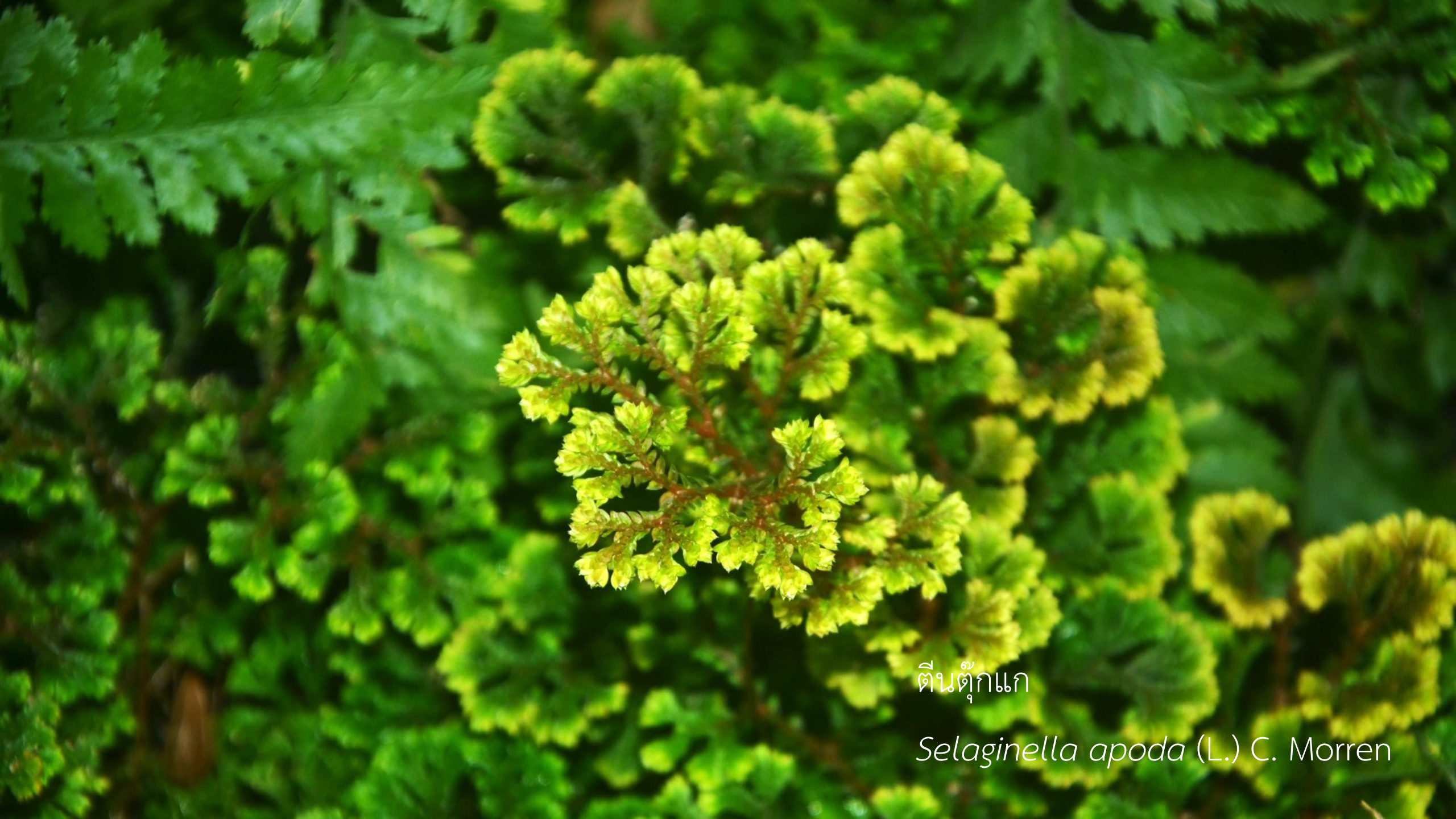
ตีนตุ๊กแก